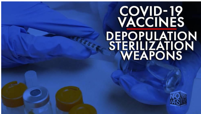
COVID-19 ワクチン／人口削減・不妊化兵器

全世界が、あらかじめ計画され、高度に組織された、犯罪的な死や傷害や病気、それにさまざまな毒性の COVID-19 注射を直接の原因とする、疾病や流産などを目撃しつつある。